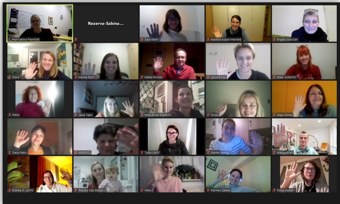
Slika 1: Zaključni pozdrav udeležencev in predavateljev ob koncu seminarja-prvi del zaslona v ZOOM-u.