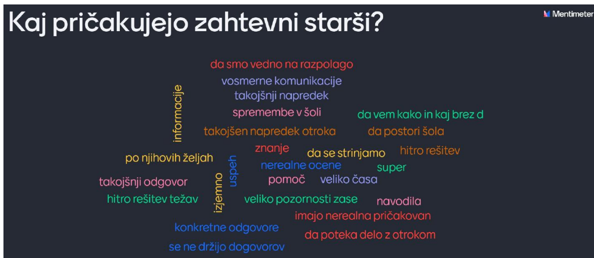
Slika 1: Odgovori udeleženk, v aplikaciji Mentimeter