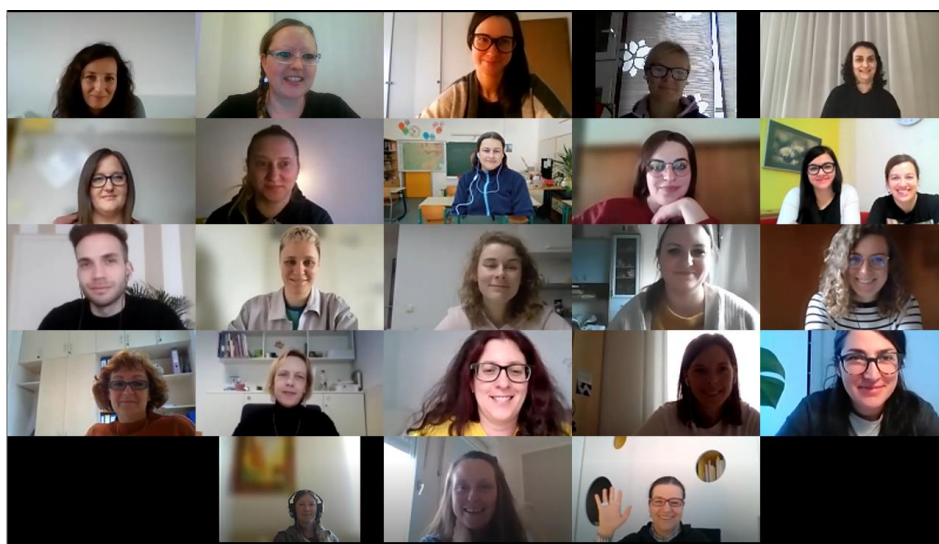
Slika 1: Zaključni pozdrav udeleženk/ca in predavateljice ob koncu seminarja.