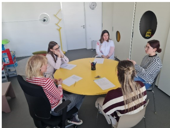
Razprava v manjših skupinah o izzivih in učinkovitih strategijah pri delu z učenci s ČVT (fotografija desno).