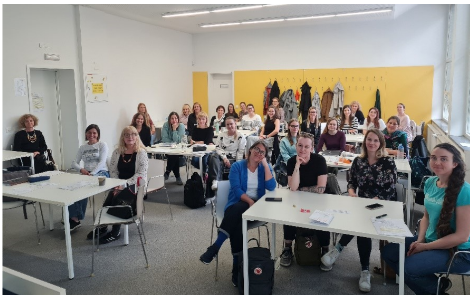
Zaključna skupinska fotografija. :)

Zapisala: Sara Marn Ljubljana, 23. 4. 2025